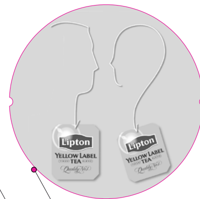
отсутствует вылет за обрез 5 мм